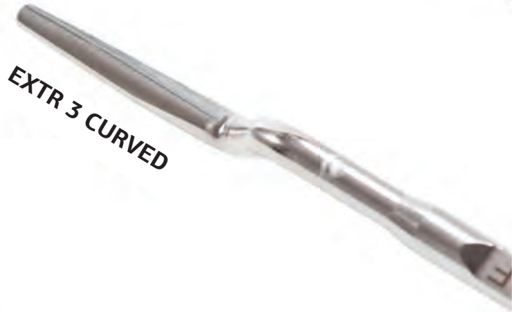
EXTR 3 CURVED