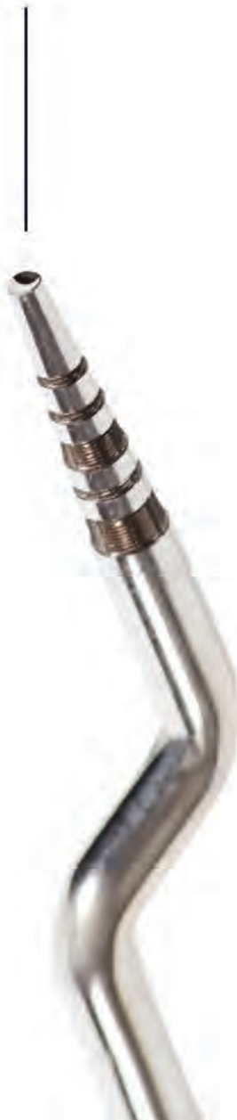
6 Easy-In Curved