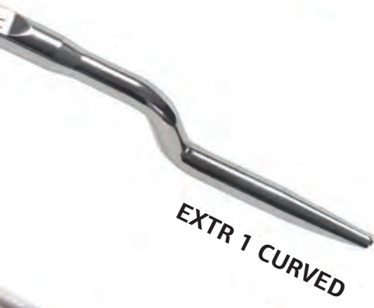
EXTR 1 CURVED