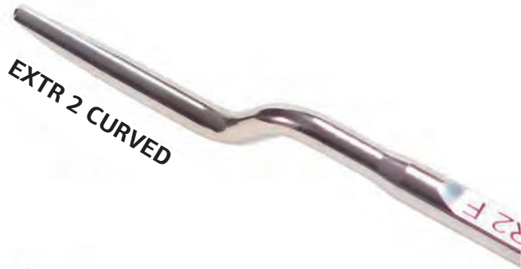
EXTR 2 CURVED