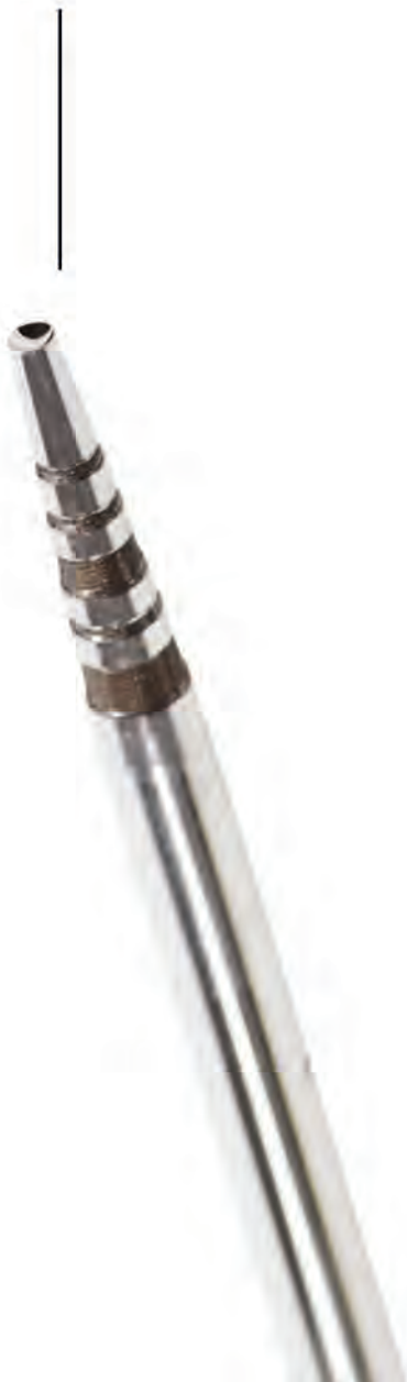
6 Easy-In Straight