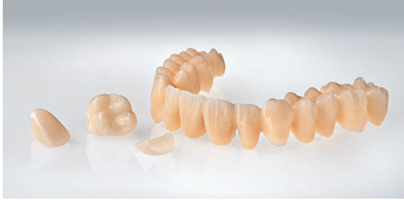
Ευρύ φάσμα ενδείξεων, χάρη στην υψηλή αντοχή στη θραύση