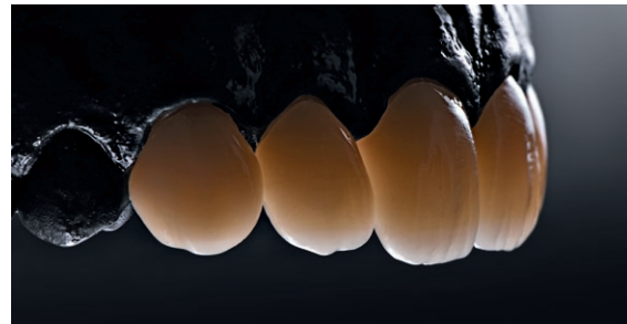
Φυσικά αισθητικά αποτελέσματα