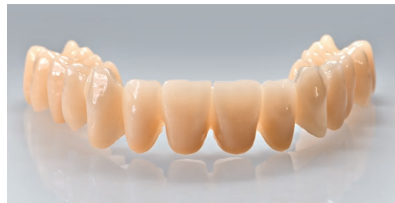
Ελάχιστη περιεκτικότητα σε υπολείμματα μονομερών