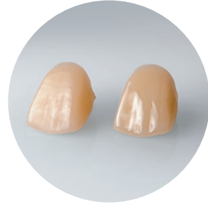
Εξαιρετική συμπεριφορά στην κοπή και καλές ιδιότητες στίλβωσης