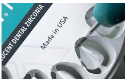
Εύκολος διαχωρισμός και πολύ καλή κατεργασιμότητα