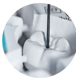
Βελτιστοποιημένες ιδιότητες υλικού για μακρά διάρκεια ζωής των εργαλείων κοπής