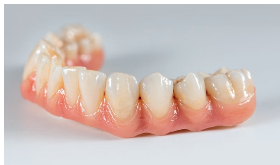
Αισθητικά αποτελέσματα με μέγιστο εύρος ενδείξεων