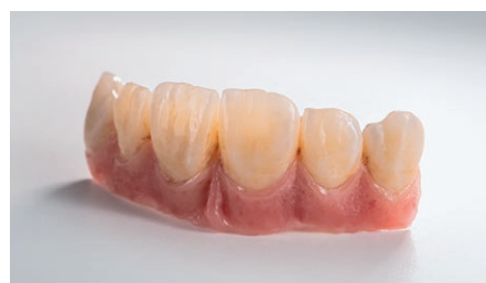
NexxZr + λευκό με εξατομικευμένη διήθηση και επικάλυψη