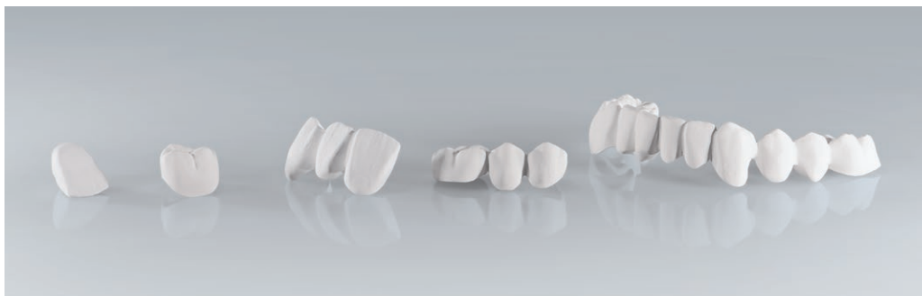
Ευρύ φάσμα ενδείξεων