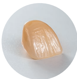
NexxZr + προχρωματισμένο