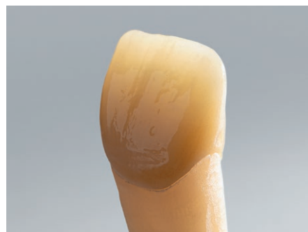
Εξαιρετες αισθητικές ιδιότητες